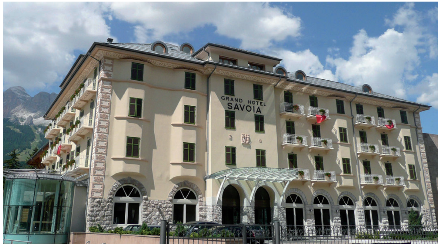
Il Grand Hotel Savoia riapre ai suoi ospiti dopo l'accurato restauro durato 5 anni. Sotto la hall e una camera dell'hotel

Santino Galbiati e Mythos Hotels danno il benvenuto in un'atmosfera elegante